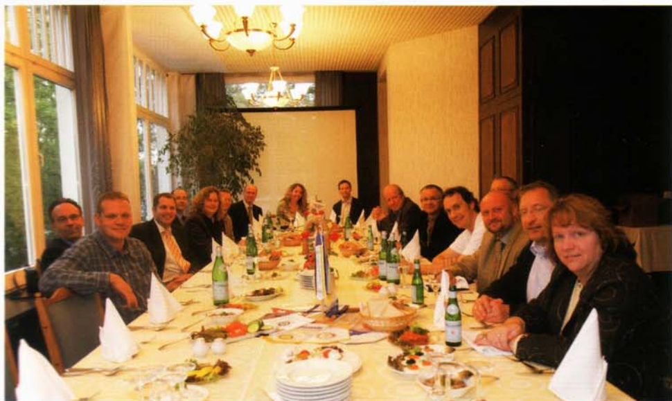
Klassentreffen-Atmosphäre beim gemischten Rotary-Club Leipzig-Alte Börse