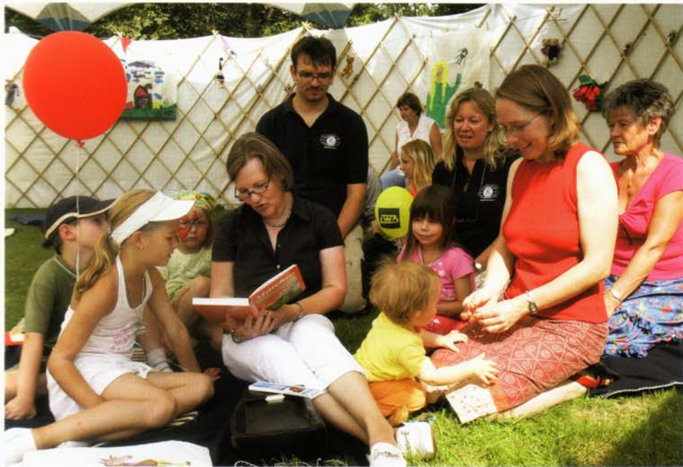
Das Vorleseprojekt der Kiwanier beim Parkfest im Schönauer Park in Leipzig-Grünau